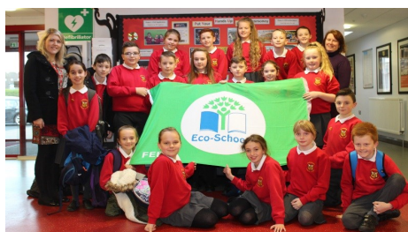
Déanann Carmoney Primary School ceiliúradh ar ghradam an Bhrait Ghlais