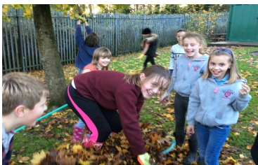
Andrews Memorial PS - Glasú

Ná déan dearmad gur féidir do dhílseacht don fheachtas Live Here Love Here a dhearbhu anseo agus an nuacht is deireanaí a fháil ar na gníomhaíochtaí i do cheantar féin.