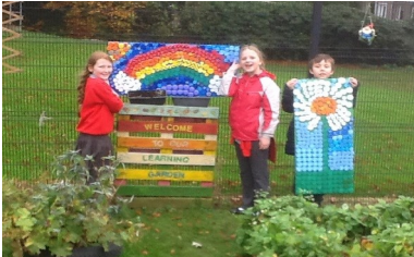
Six Mile Integrated PS—Gléasadh