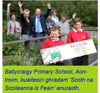
Ballycraigy Primary School, Aontroim, buaiteoirí ghradam 'Scoth na Scoileanna is Fearr' anuraidh.

An bhfuil tailte agus foirgnimh scoile agaibh atá slachtmhar néata agus sibh dírithe ar an timpeallacht agus daltaí atá spreagtha agus rannpháirteach? Chuir beagnach 200 isteach anuraidh ar Ghradaim na Scoileanna is Slachtmhaire' a réachtálann Northern Ireland Amenity Council. Spreagann an comórtas idir fhoireann agus dhaltáí chun comhoibriú agus timpeallacht comhshaoil na scoile a fheabhsú.