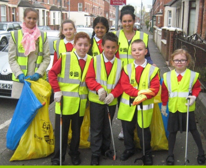
Holy Family Primary School, Béal Feirste, ag glacadh páirt i nGlantóireacht MHÓR an Earraigh 2016.

Ná déan dear- mad do tha- caíocht don fheachtas Live Here Love Here a gheal- ladh agus an nuacht is deir- eanaí a fháil faoi na rudaí atáthar a dhé- anamh sa phobal