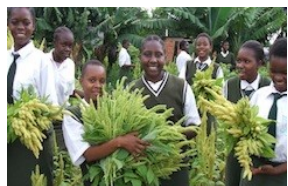
Daltaí ó Ardscoil Goibei ag baint sult as fómhair barr s'acu

Chláraigh Ardscoil Goibei le Gréasán Éicea-Scoileanna na Céinia i 2004. Ó shin i leith, tá a lán tionscadal ar siúl ag an scoil, ina measc bailiú fearhainne ón díon, táirgeadh barr agus beostoic agus sábháil fuinnimh. Tá an bheachaireacht chun mil a tháirgeadh ar cheann de na tionscadail is rathúla agus is dóigh mhaith í chun dul in oiriúint don athrú aeráide agus soláthar an bhia a chinntiú. Ba ghníomhaíocht thábhachtach ghinte ioncaim an fiontar ag Ardscoil Goibei ó 2007. Ní amháin gur éirigh leis an tionscadal an céatadán bochtán a laghdú trí fhiontraíocht áitiúil a spreagadh ach d'éirigh leis foinse eile ioncaim a chruthú lena chois sin.