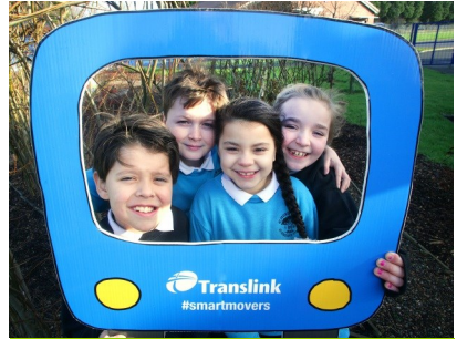
Tá Cranmore Integrated Primary, Béal Feirste, ar bord don Dúshlán Taistil

Ní amháin gur chun tairbhe na timpeallachta atá na modhanna gníomhacha inbhuanaithe taistil seo ach cuidíonn siad fosta le teaghlaigh airgead a choigilt, sláinte mheabhrach agus fhísiceach a fheabhsú agus róphlódú ag geataí na scoile a laghdú.