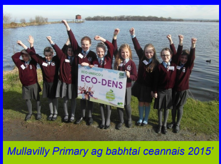
Mullavilly Primary ag babhtá ceannais 2015'

Ócáid spreagúil a bheas ann nuair a bheidh babhta ceannais réigiúnach an Ghradaim Comhshaoil Óig ECO-UNESCO ar siúl in Ionad Fionnachtana Loch nEathach/Lough Neagh Discovery Centre, den 6ú huair as a chéile. Is clár gradam uile-Éireann é Gradaim an Chomhshaoil Óig ina dtugtar aitheantas agus duais do dhaoine óga a ardaíonn feasacht chomhshaoil agus a chuidíonn lena dtimpeallacht áitiúil a fheabhsú.