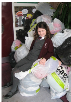
Bailiúchán geansaithe Loanends PS 2015

Chun bailiúchán éadaí 'Cash for Clobber' a shocrú do do scoil, gabh i dteagmháil le CTR ag schools@c-t-r.com nó cuir scairt ar 028 9447 8880.