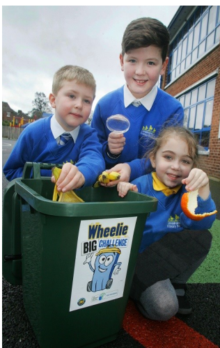
Déanann daltaí Lisnasharragh Primary iniúchadh ar dhramhbhia