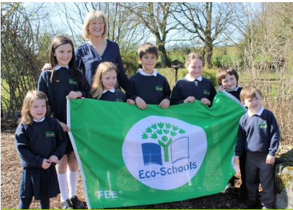
Dromore Primary, an Ómaigh