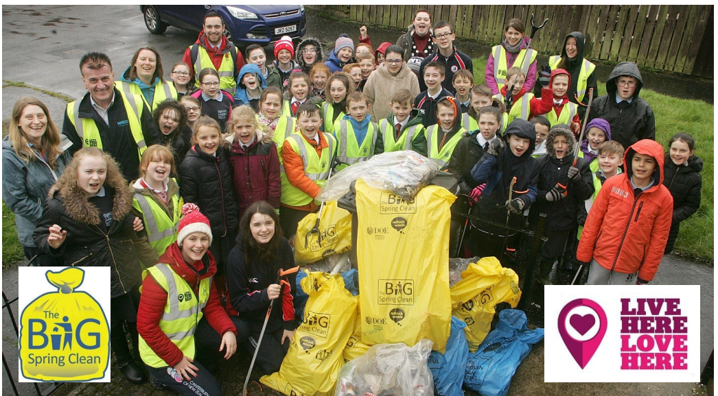
Daltaí ó Ghlanadh Suas Fairview Primary, Ballyclare Primary, Tír-na-nÓg Primary agus Ballyclare High.

Tá an glantachán mar chuid d'fheachtas Wrigley's Litter Less ag Fairview', trína ndéanfaidh siad féin, agus tríocha scoil eile ar fud Thuaisceart Éireann a seacht ndícheall dul i ngleic leis an bhrúscar agus an dramháil. Tá lúcháir ar Keep Northern Ireland Beautiful go mbeidh muid i mbun an fheachtais don chúigiú bliain trí chlár Éicea-Scoileanna i gcomhpháirt leis an Fhondúireacht don Oideachas Imshaoil. Tá an feachtas domhanda seo á réachtáil in 31 tír ar fud na cruinne, ag ardú feasachta maidir le fadhbanna bruscair agus ag spreagadh athruithe dearfacha iompraíochta.