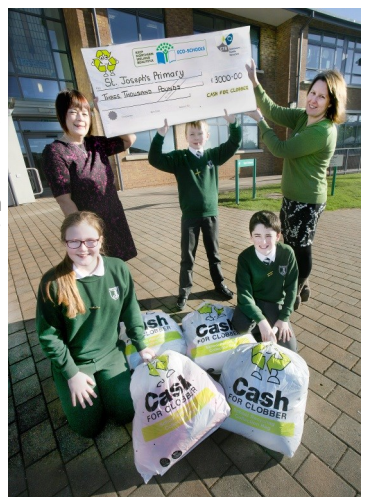
St Joseph's Primary, Ceathrú Ul Dhuibh, buaiteoirí in 2015.

An scoil is mó a bhailíonn seanéadaí in aghaidh an dalta, bainfidh sí duais iontach airgid. Tá trí bhanda ann le duaiseanna a bhaint, ag brath ar mhéid do scoile.