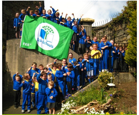
Bunscoil an Iúir, Iúr Cinn Trá