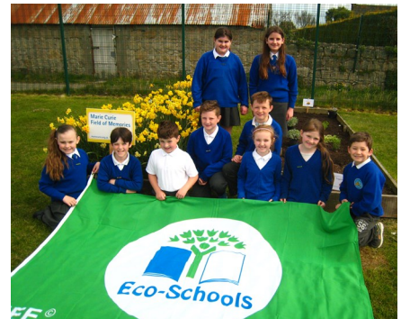
St Colman's Primary, Cill Chaoil