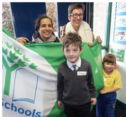
Belmont Primary School ag cur fáilte roimh chuairteoirí idirnáisiúnta i 2015.