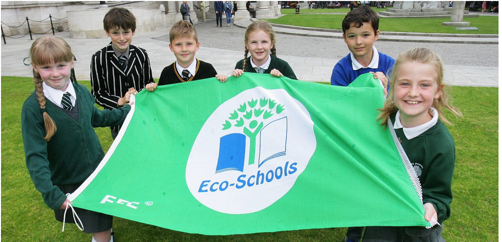
Daltaí de chuid St Kieran's Primary, Campbell College Junior School, Christ the Redeemer Primary, Greenwood Primary agus Knockbreda Primary ag ceiliúradh an Bhrait Ghlais ag Halla na Cathrach.

Táimid ag súil le tógáil ar an scothbhliain seo agus tacú le tuilleadh scoileanna stádas Brat Glas a bhaint amach. Féach ar an nuachtlitr agus ar ár suíomh gréasáin , twitter agus facebook le haghaidh smaointe agus déan teagmháil linn le ceisteanna atá agat faoin chlár eco-schools@keepnorthernirelandbeautiful.org .