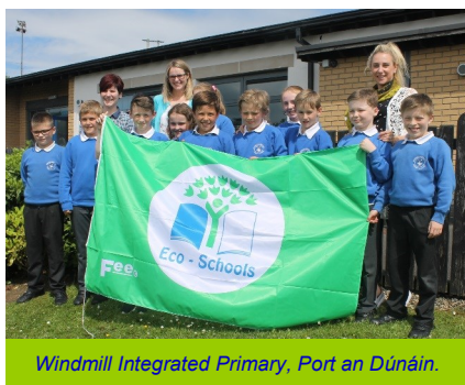
Windmill Integrated Primary, Port an Dúnáin.