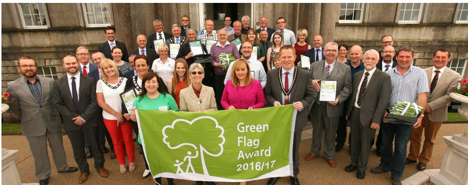
Bronnadh Brat Glas ar 51 Páirc agus Achar Glas le haghaidh 2016/17.