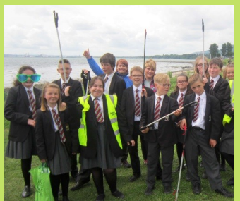
Thóg daltaí de chuid Ulidia bruscar fá chladach Loch Lao ar an Lá Glas i mí an Mheithimh.

D'eagraigh Ulidia Integrated College, Ambasadóir Éicea-Scoileanna le haghaidh Peirspectíochtaí Domhanda, an Lá Glas bliantúil ag deireadh an téarma. Bíonn an scoil ar fad gafa le ngníomhaíochtaí timpeallachta atá oideachasúil agus spraiúil. I mbliana thug Ulidia cuireadh do dhailtaí as Acorn Integrated Primary le sult a bhaint as an lá. Tá Ulidia mar mheantóir ag Acorn atá ag díriú ar a gcéad Bhraít Glas i mbliana. Labhair aíonna ó Éicea-Scoileanna, Trócaire, Ulster Wildlife, Ollscoil na Ríona agus ISL agus bhí taispeántas éan creiche ann ag deireadh an lae. Thóg na daltaí bruscar agus rinne plandú faoin scoil agus sa cheantar thart timpeall uirthi.