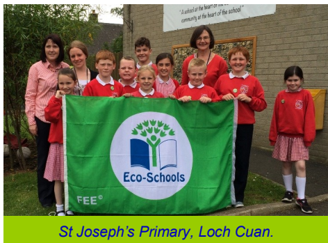
St Joseph's Primary, Loch Cuan.

Is iontach linn i gcónaí eolas agus díograis na ndaltaí agus na foirne sna scoileanna a bhuaigh Brat Glas agus tá siad le moladh go mór as a bhfuil bainte amach acu.