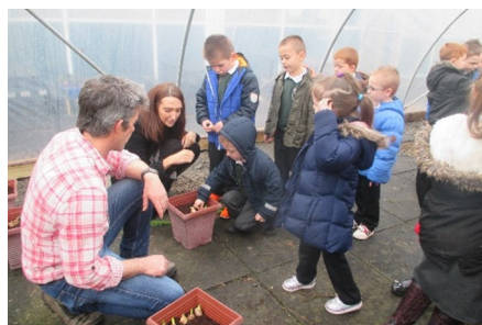
D'úsáid Killycooley Primary a maoiniú le spásanna foghlama lasmuigh a athnuachan

Dearadh Scéim na Miondeontas chun cuidiú le grúpaí feabhas a chur ar chaighdeán a dtimpeallachta áitiúla, agus mórtas saoránachta a chothú i bpobal nó chun turasoireacht a fheabhsú ina bpobal féin trí fheabhsúcháin chomhshaoil. Le cur isteach air, líon amach pacáiste iarratais simplí á rá cén dóigh a