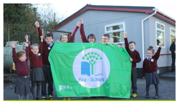
Knocknagor Primary, an Ómaigh