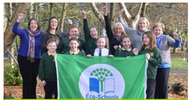
Ballykelly Primary, Léim an Mhadaidh