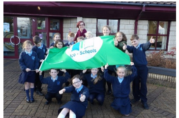
Hazelwood Integrated Primary, Baile Nua na Mainistreach